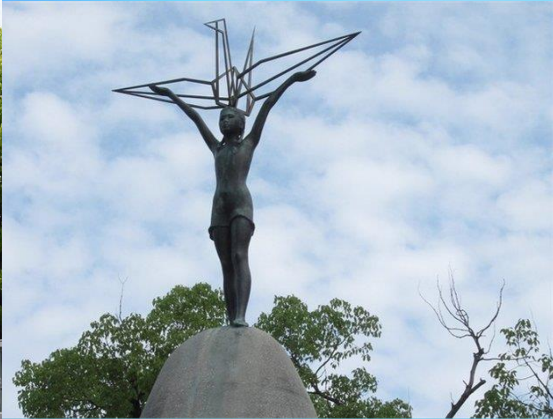
Памятник Садако Сасаки